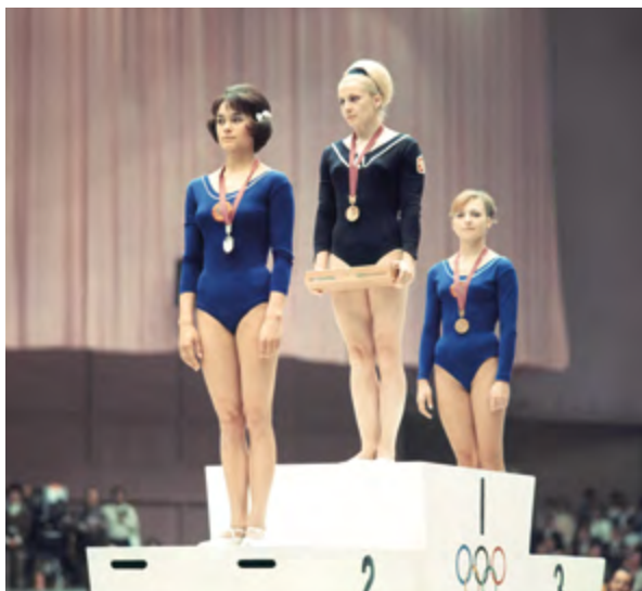
◀ PODI DE LA COMPETICIÓ FEMENINA INDIVIDUAL DE GIMNÀSTICA RÍTMICA AMB LA GUANYADORA TXECOSLOVACA VERA CASLAVSKA (CENTRE), ACOMPAYADA PER LES SOVIÈTIQUES NATALYA KUCHINSKAYA I ZINAIDA VORONINA.