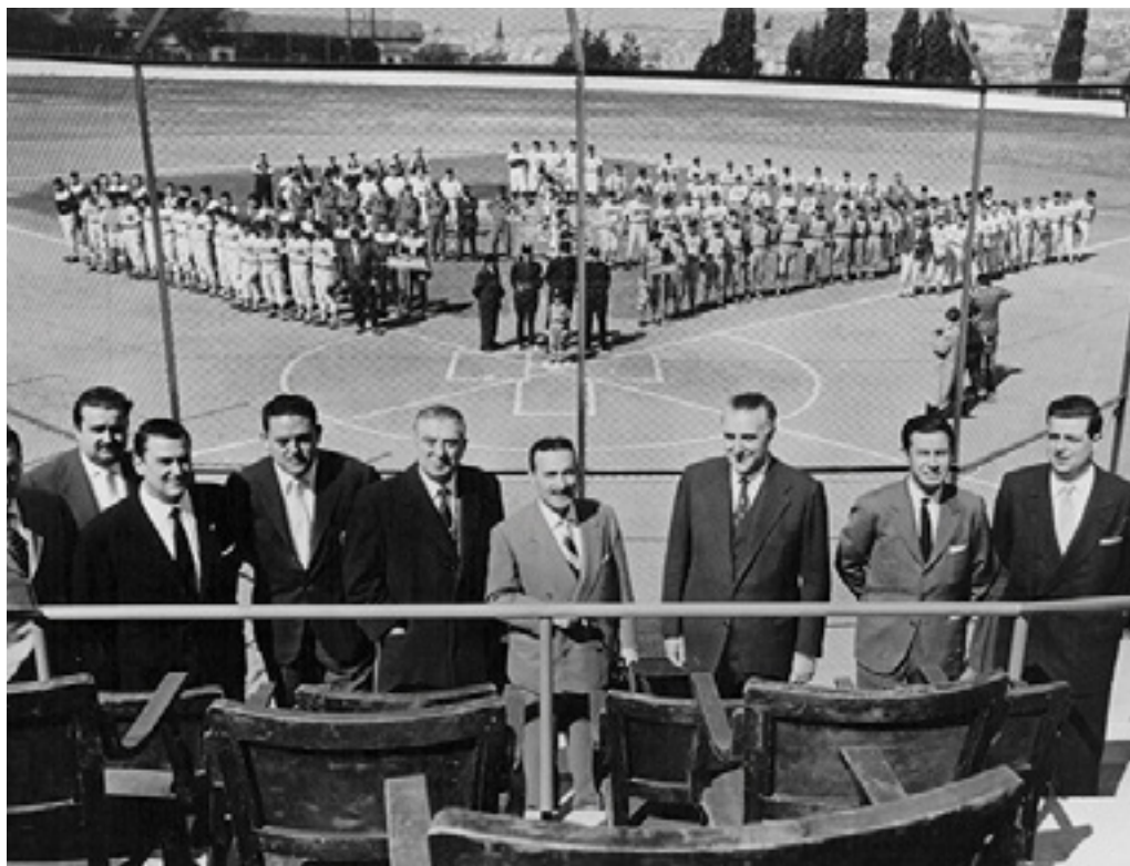
Font: Pilar Fort Lleixa