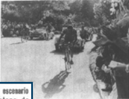
Montjuich, escenario de una etapa de la Vuelta a Francia